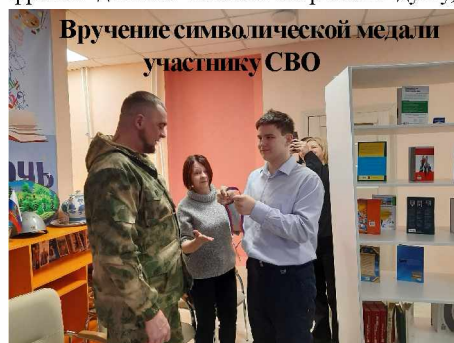
Вручение символической медали участнику СВО