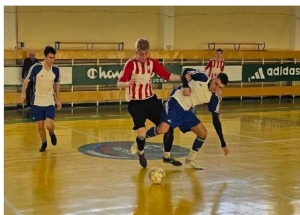
Фрагменты матча между командой ДЮСШ и командой п. Ягодное