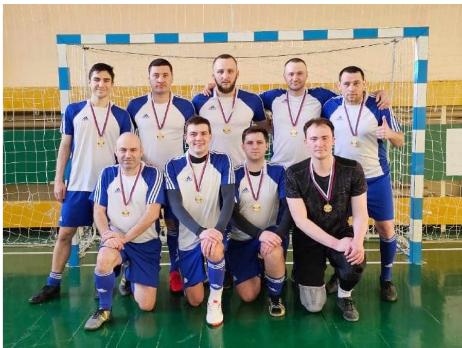
Победители районного турнира по мини-футболу, посвящённого Дню защитника Отечества

Турнир проходил по круговой системе. Все участники спортивного мероприятия показали высокий уровень физической подготовки, слаженности, бо-