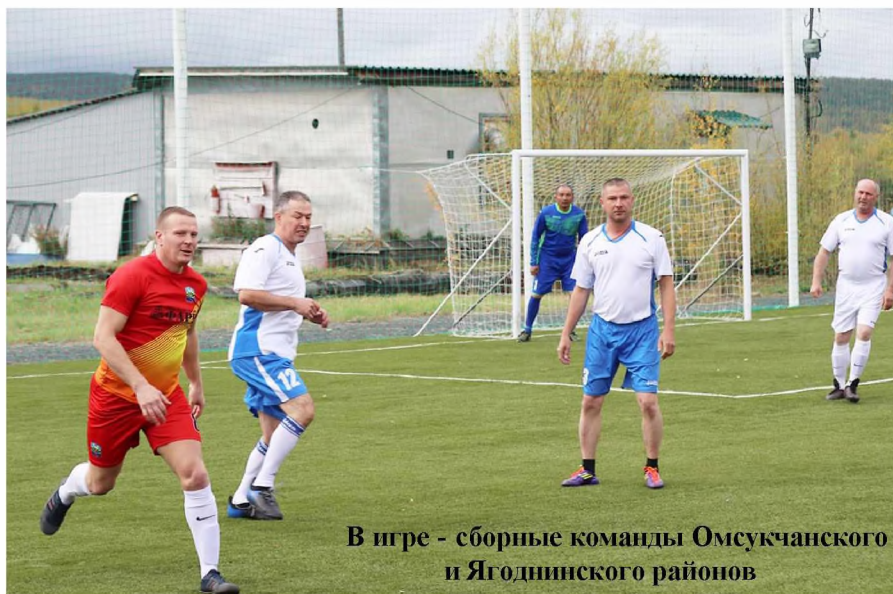
В игре - сборные команды Омсукчанского и Ягоднинского районов

УЧРЕДИТЕЛЬ - Администрация Ягоднинского муниципального округа Магаданской области.