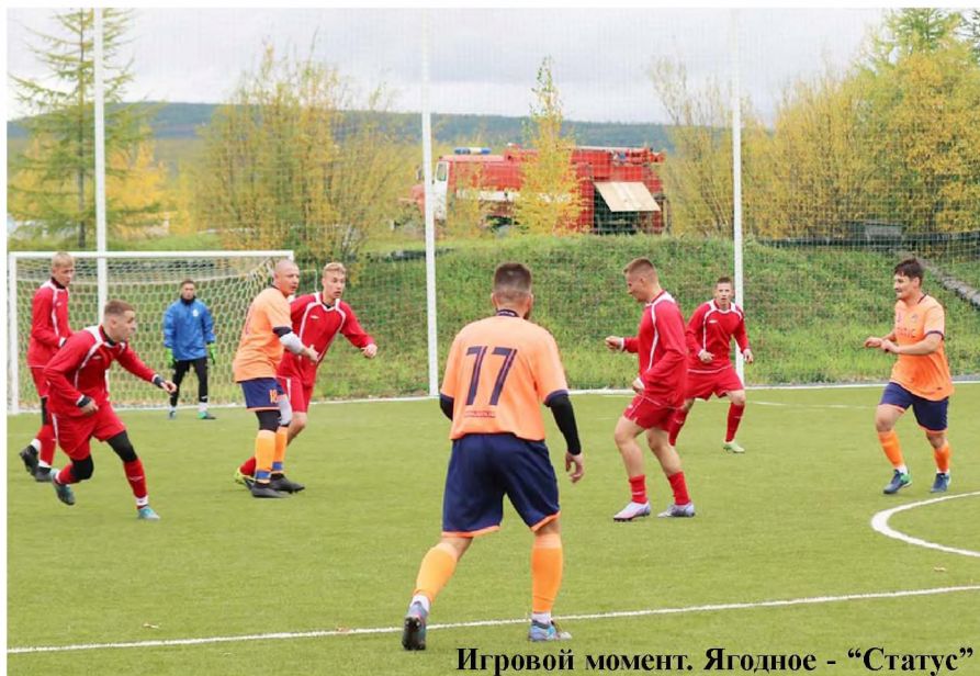
Игровой момент. Ягодное - «Статус»

В результате не менее напряжённой борьбы призовые места распределились следующим образом: 1-е место и приз в размере 300 тысяч рублей получила команда Омсукчанского района,