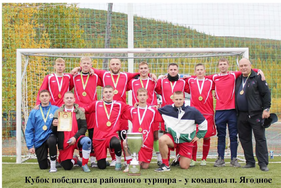
Кубок победителя районного турнира - у команды п. Ягодное

Финальным аккордом этого футбольного праздника стала серия пе-