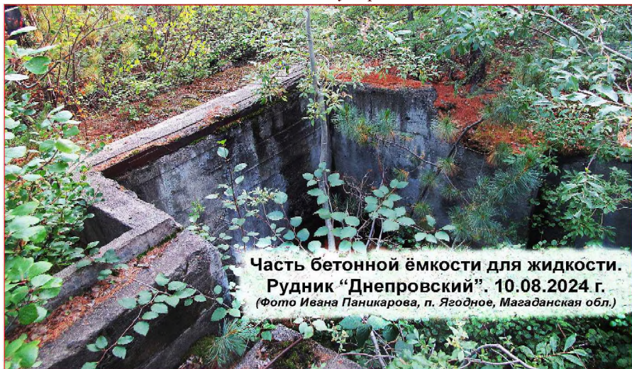
Часть бетонной ёмкости для жидкости. Рудник “Днепровский”. 10.08.2024 г.