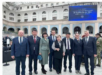
Председатели заксобраний субъектов ДФО на Послании Президента РФ