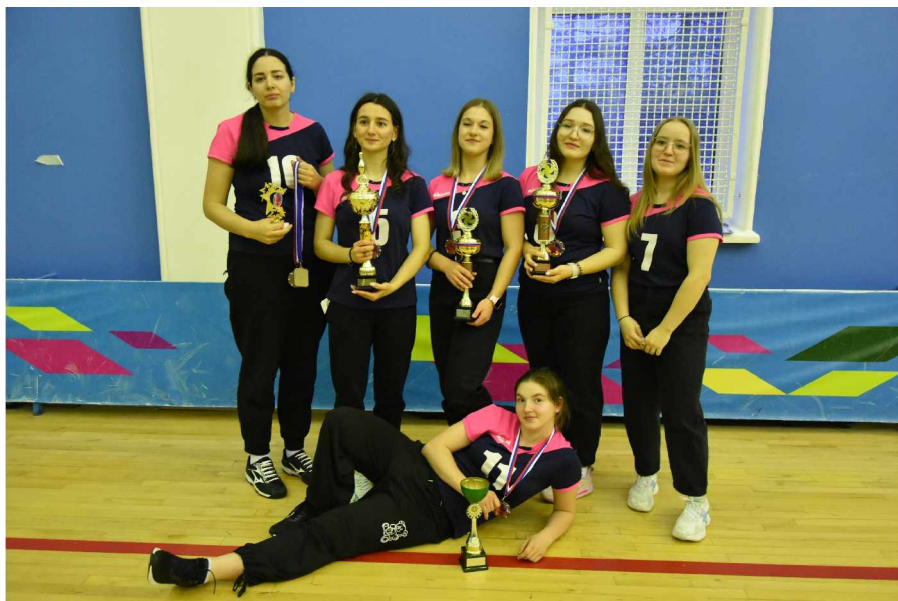
Бронзовые призёры XXI Спартакиады муниципальных образований Магаданской области по волейболу среди женских команд

Команды-участницы не были поделены на подгруппы. Соревнования проводились по круговой системе, победи-