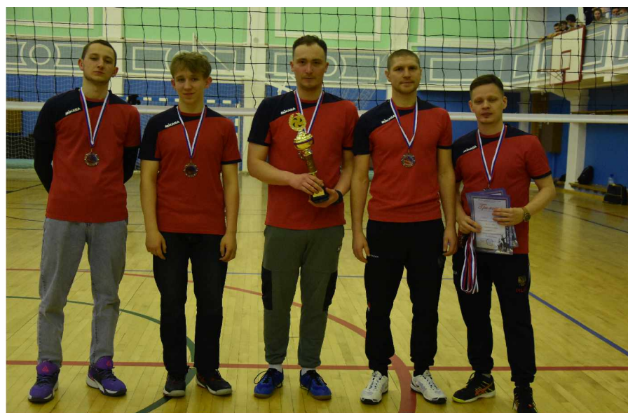
Бронзовые призёры XXI Спартакиады муниципальных образований Магаданской области по волейболу среди мужских команд

тель определялся по количеству набранных очков.