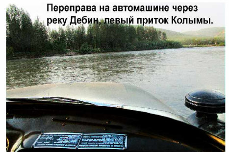
Переправа на автомашине через реку Дебин, левый приток Колымы.

Спрашиваю их: «А если со мной, почти 70-летним стариком, или с кем-то из вас что-то случится?..» Ответ был чуть ли не хором: «Не беспокойтесь, в беде