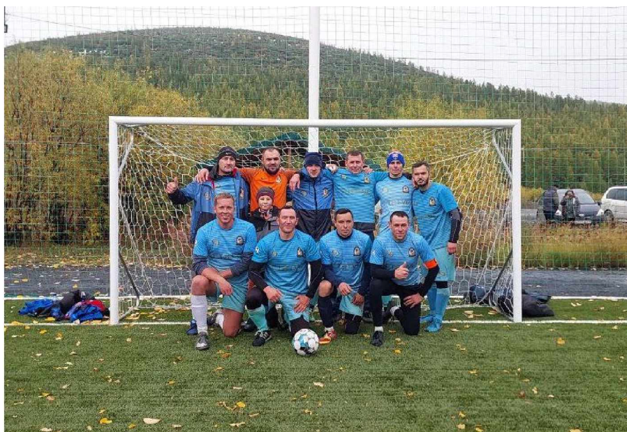
Команда “Статус” - победитель районного турнира по мини-футболу на призы артели старателей “Кривбасс”.

Победители двух турниров - «Кривбасс» и «Статус» были награждены традиционными главными призами - свинкой, кубками артели старателей «Кривбасс», денежными призами по 300 тыс. рублей. Призерам двух турниров - командам Омсукчанского района и п. Ягодное за второе место были вручены кубки и по 200 тыс. рублей, за третье место командам Ягоднинского района и п. Синегорье были вручены кубки и денежные призы по 100 тыс. рублей. Всем командам, принимающим участие в турнире, а также победителям в номинациях были вручены денежные призы.