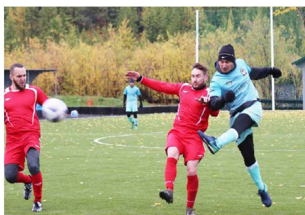
Фрагмент матча между командой “Статус” и командой п. Ягодное.