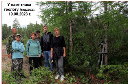
У памятника геологу (справа). 19.08.2023 г.