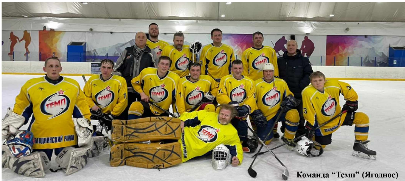
Команда “Темп” (Ягодное)