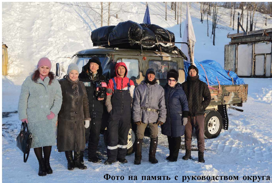
Фото на память с руководством округа