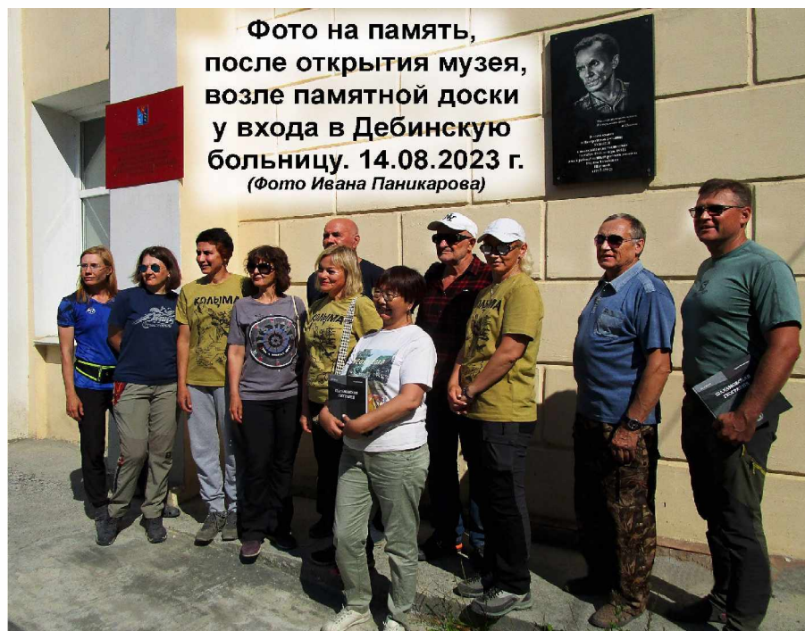
Фото на память, после открытия музея, возле памятной доски у входа в Дебинскую больницу. 14.08.2023 г.